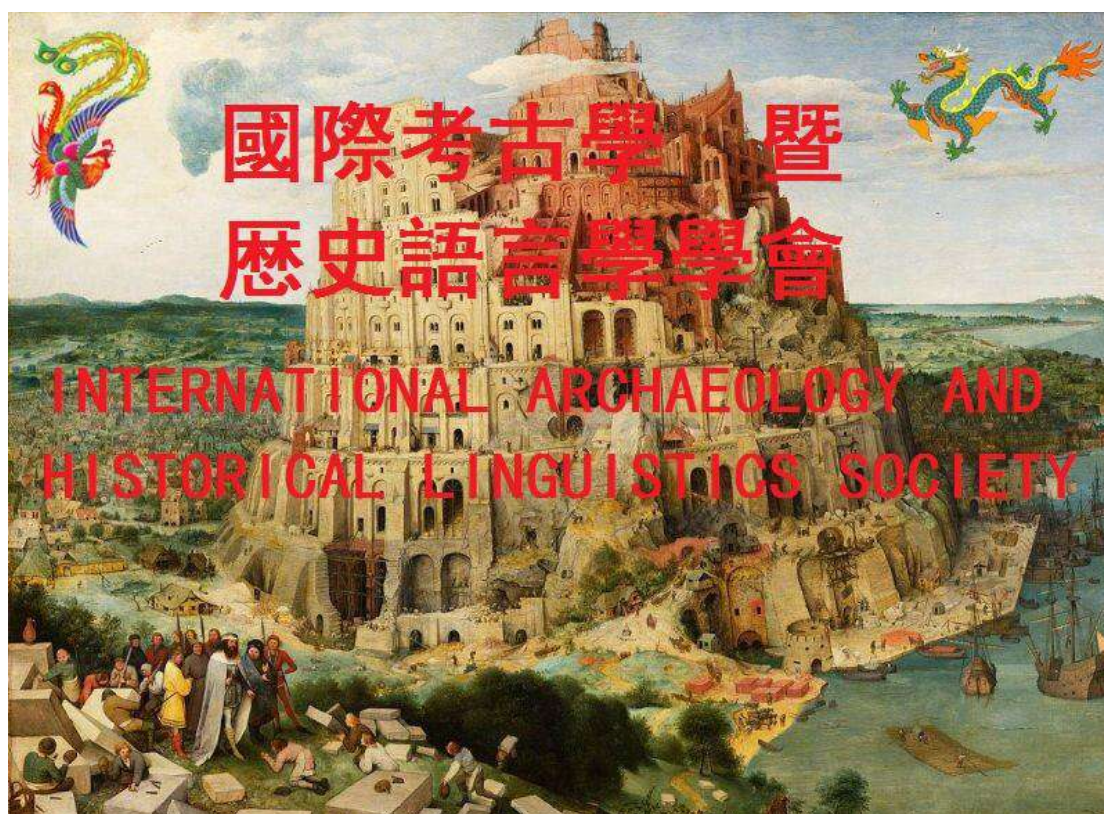
國際考古學暨歷史語言學學會會旗

國際考古學暨歷史語言學學會，是 2016 年由著名歷史學家、古文字學家、易學家、漢學史家、前中國人民大學教授、前中國華東師範大學教授、前日本愛知學院大學客座研究員、前日本京都大學研究員、日本國文學博士劉正（族名劉元正）先生在美國發起成立並得到了美國德州政府的支持和批准註冊的國際一級學術團體。現有正式成員涉及到十四個國家數百名國際上著名學者加盟。有正式官網（官網地址是： www.iahls.org ）。並有正式的微信公共號《考古暨歷史語言通訊》作為本學會微刊、有正式出版發行的多語言電子期刊季刊《國際考古學暨歷史語言學學會學報